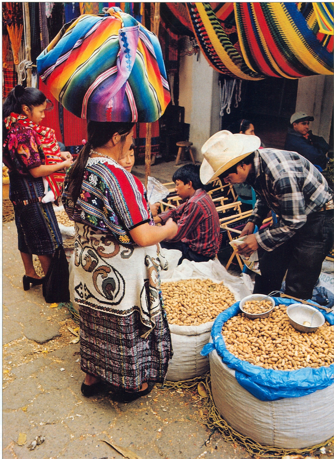
TRADIČNÍ INDIÁNSKÝ TRH V CHICHICASTENANGU JE PESTROU KOLÁŽÍ BAREV, VŮNÍ I ZVUKŮ.