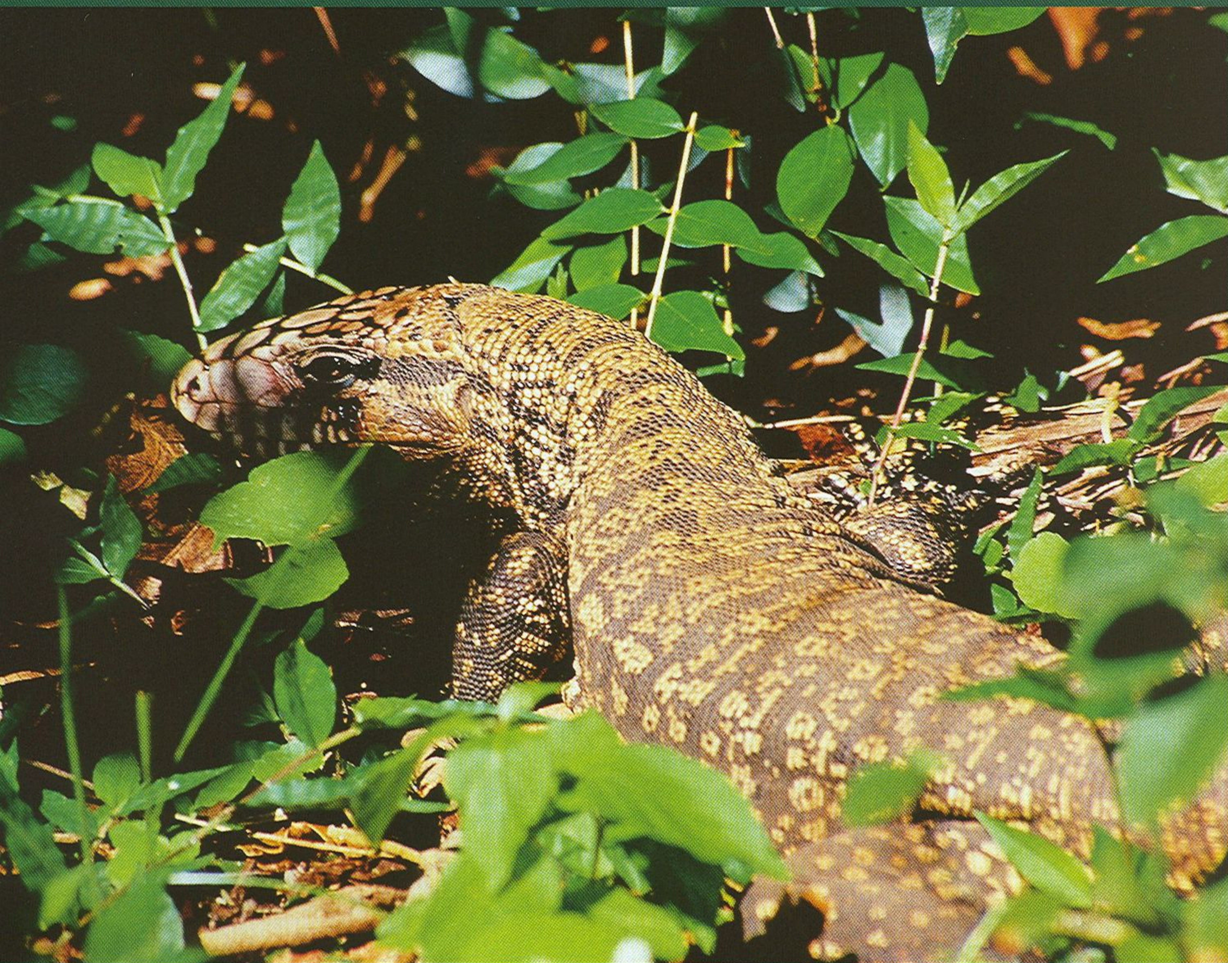
Největším zástupcem čeledi tejuvitých je teju pruhovaný ( Tupinambis meriana ) dorůstající přes 130 cm.