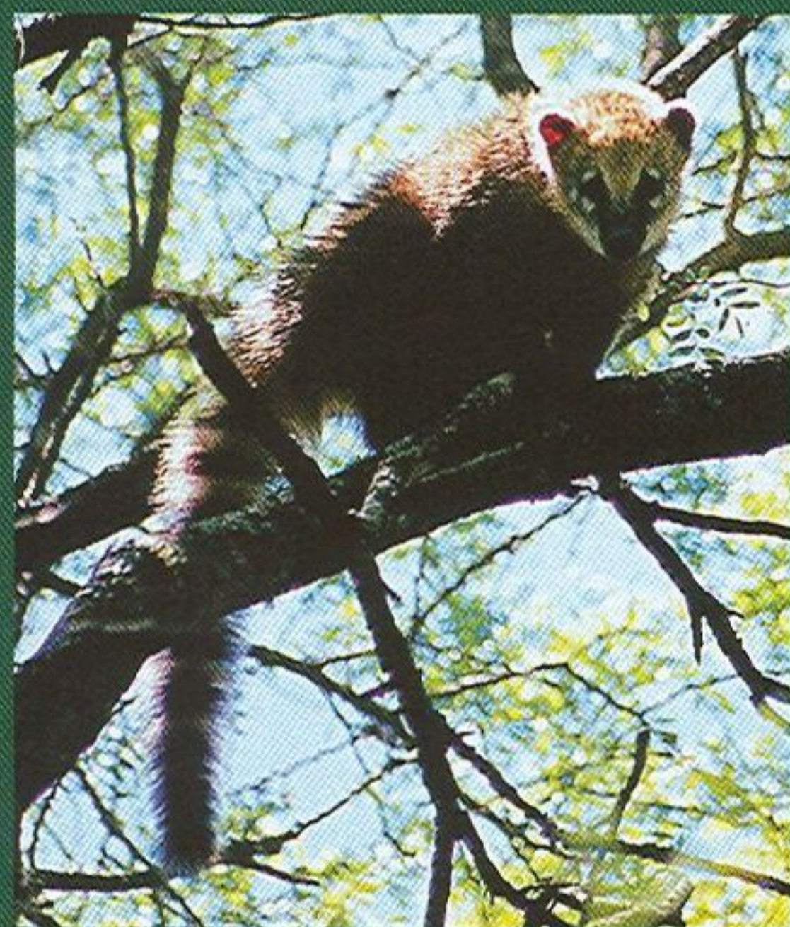
Nosála červeného ( Nasua nasua ) potkáte nejčastěji ve skupinkách, které v případě ohrožení hledají útočiště na stromech.

(v argentinském slovníku výraz vegetarián chybí, nadávky ostatně ve slovníku většinou nebývají), prožil dezert v podobě intermezza se smečkou psů, kteří mě mírně pokousali, a dostal dvouhodinovou sprchu u silnice. A pak jsem konečně dorazil do města Ituzaingo. Pohrdl jsem luxusně vypadajícím hotelem za 10 pesos a šel do údajně levnějšího, kde jsem tutéž částku nakonec zaplatil za umouňenou místnost se šváby. Byli v ceně.