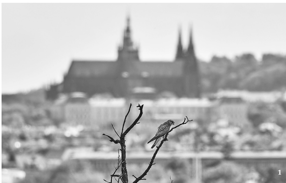
1 Městská fotografie má přiznat místo svého vzniku. Když pražská poštolka, pak třeba Hradčany. Snímek z 10. května 2022 (tedy před premiérou filmu Planeta Praha, kde je podobná scéna).

Tvrzení o úbytku kosa černého ( Turdus merula ) v souvislosti s urbanizací straky obecné ( Pica pica ) je pak ryzí spekulace, bez jakékoli solidní empirické podpory (str. 417). Autoři odkazují na dva zdroje: článek D. W. Grooma (1993) a pražský hnízdní atlas (Fuchs a kol. 2002), který kromě vlastních dat opět odkazuje na stejný článek. Oba spojuje zásadní metodická chyba: identita predátorů byla určována pomocí plastelínových vajec. Zjistit, kdo hnízdo predoval jen podle otisků v plastelíně, však nelze – a je to známo minimálně 20 let (Thompson a Burhans 2004 a mnoho navazujících studií). Šíření stračího mýtu kýmoli jiným než myslivci, známými zobecňovači anekdotických pozorová-