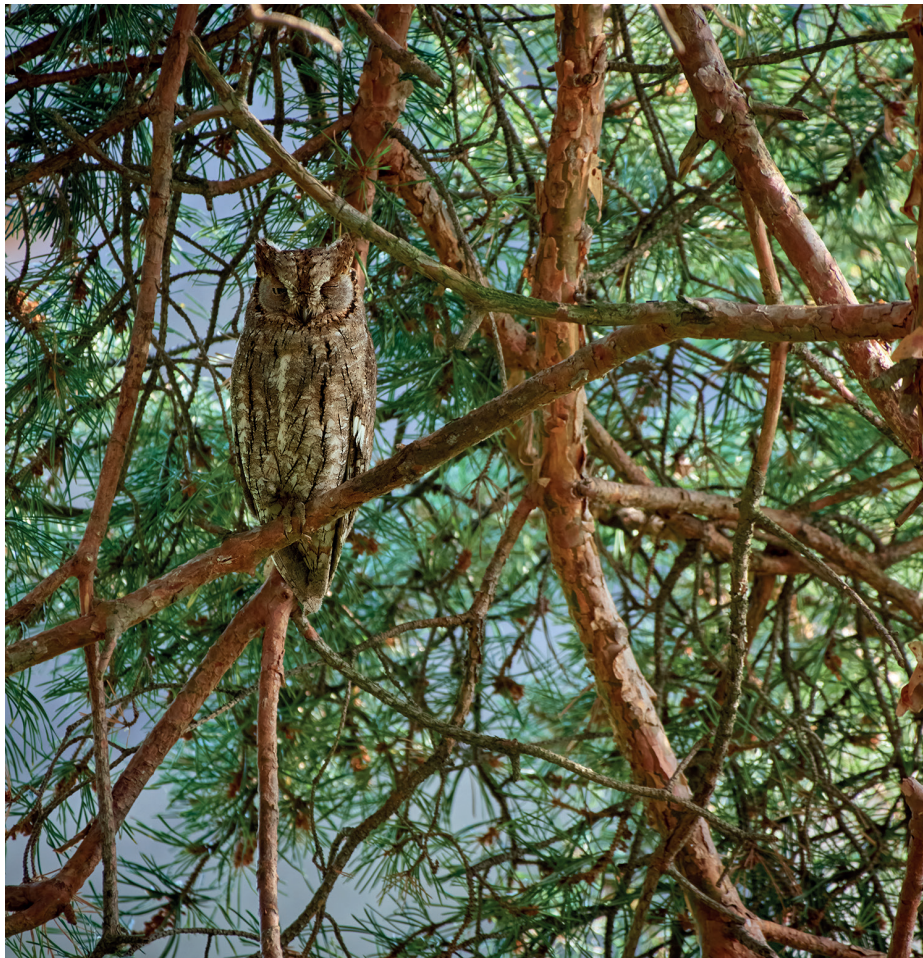
Výřeček deňuje u příjezdové cesty k hotelu Flora. Tam proběhlo druhé hnízdění v dutině téměř 20 m nad zemí.

Základním nedostatkem tzv. urbání ornitologie kdekoli na světě je prakticky úplná absence přesných informací o tom, kdy který druh do daného města přišel. Je to až k neuvěření, neboť i v dobře prozkoumaných městech, a těch je velmi málo, máme použitelná data prvních záznamů k dispozici jen vzácně.