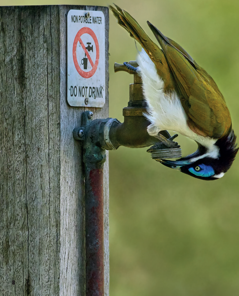
Medosavka modrolící ( Entomyzon cyanotis ), Gladstone, Queensland, Austrálie