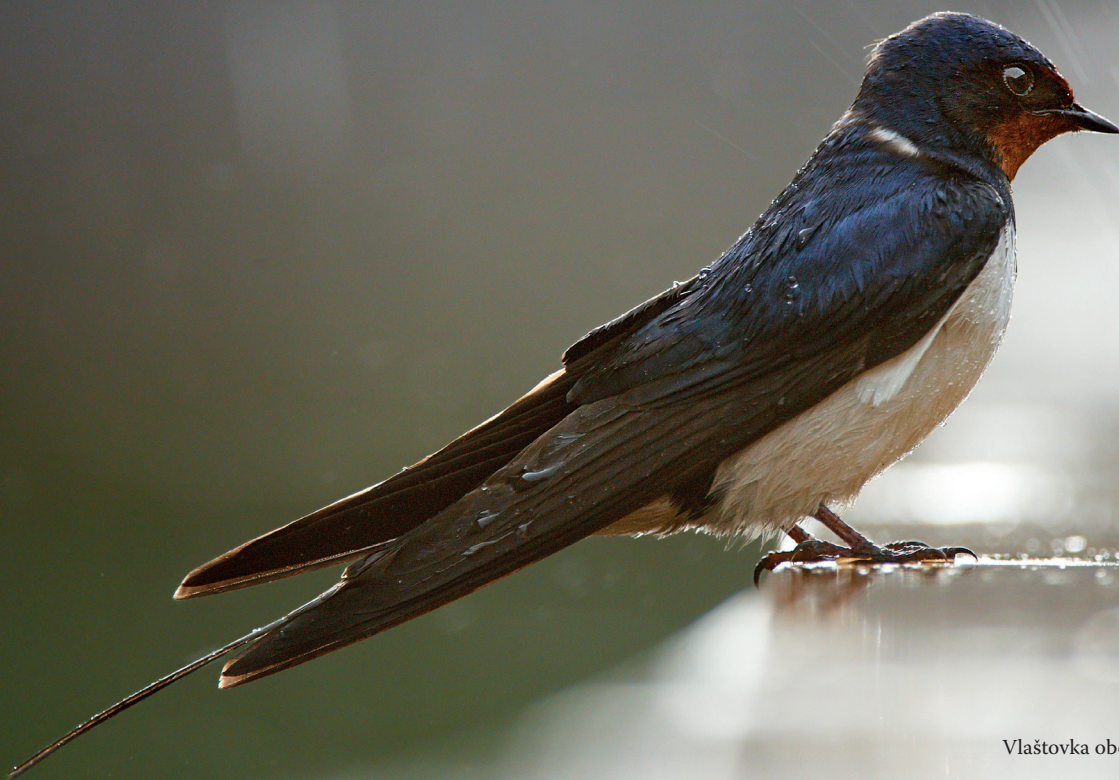
Vlaštovka obecná ( Hirundo rustica ), Siikalahti, Finsko