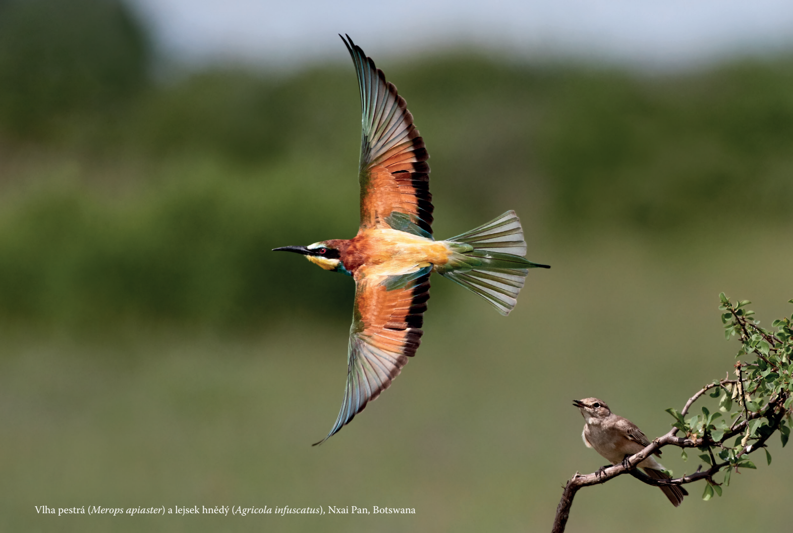
Vlha pestrá ( Merops apiaster ) a lejsek hnědý ( Agricola infuscatus ), Nxai Pan, Botswana