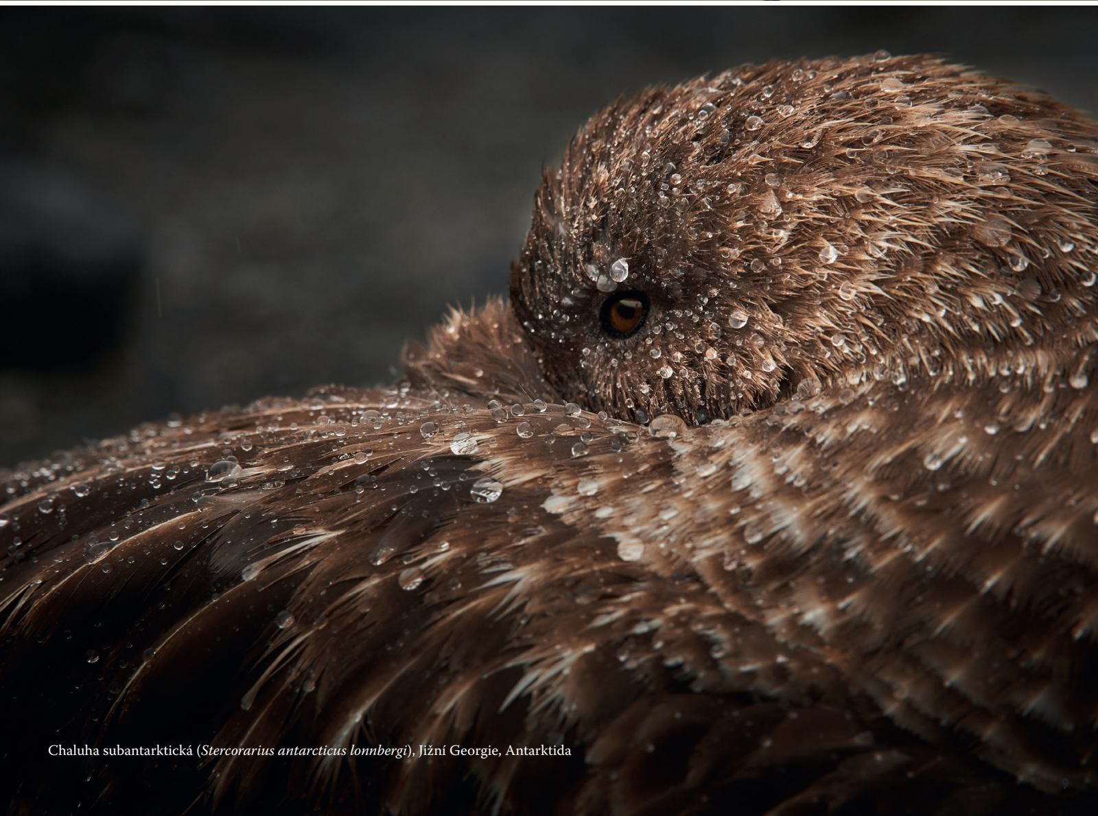
Chaluha subantarktická ( Stercorarius antarcticus lonnbergi ), Jižní Georgie, Antarktida