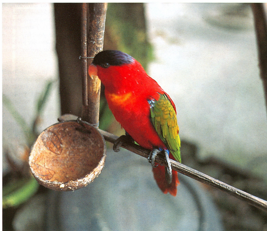
Papoušek Lorius domicella je seramským endemitem a je často chován v místních domácích

věštný zvuk motorových pil, které se zakusují do nádherného pralesa čím dál tím hlouběji. Tam, kde před necelými 2 lety sahaly původní prales až na mořské pobřeží, jsou holoseče a spáleniště o délce několika kilometrů. Na vykáčených a vypálených prostorách vyrostlo neuvěřitelných 32 osad, zvaných Units, do kterých bylo přesídleno více než 70 000 lidí z přelidněné Jávy. Těžba probíhá tak, že se nejprve vykácejí cenné stromy, hned na místě se z nich nařezou trámy a fošny a zbytek se zapálí. Pravda je, že hranice národního parku zatím těžba nepřekročila, ale park je tím zbavován ochranného pláště a zátěž způsobená dosídlováním zemědělského obyvatelstva na park a jeho bezprostřední okolí je obrovská. Původní obyvatelé několika vesnic uvnitř parku žádnou větší škodu nepůsobili. Jejich malá políčka ležela vždy v bezprostřední blízkosti osady a lov introdukovaných jelenů a prasat přírodě jen prospíval. Další ránu zasadilo Seramu objevení naftových ložisek podél západního pobřeží. Kdo chce nyní poznat skutečně neporušenou přírodu tohoto krásného ostrova, musí se vydat s pomocí nosičů a průvodců až do jeho nitra.