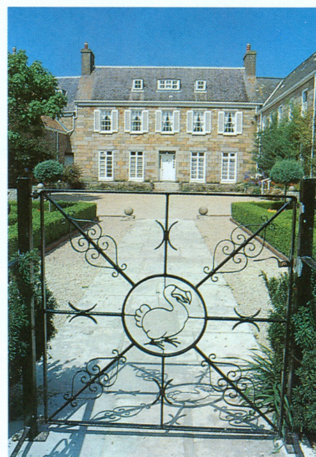
Sídlo nadace Durrell Wildlife Conservation Trust je zámeček Les Augres, postavený v příjenné parkovité krajině ostrova Jersey

Nadace často rozšiřuje mezi domorodým obyvatelstvem výchovné ochranné materiály. Jindy je jerseyjská nadace přímo vyzvána ke spolupráci: např. vláda Komor požádala o záchranu jednoho z největších kaloňů světa — Pteropus livingstonii , jehož populace klesly v přírodě na pouhých 200 jedinců.