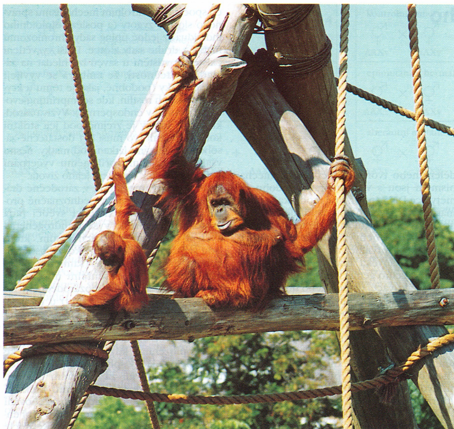
Orangutaní matka s mládětem ( Pongo pygmaeus ) v prostorném a účelně zařízeném přírodním výběhu na ostrůvku v zoologické zahradě na britském ostrově Jersey. (k článku na str. 143)